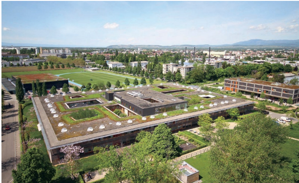
Die REHAB Basel, unterstützt von der IC Unicon AG

Nach einem Schädelhirntrauma oder einer längeren Behandlung auf der Intensivstation zeigen bis zu 70 % aller Patientinnen und Patienten schwere Verhaltensauffälligkeiten. Eine standardisierte Rehabilitation scheidet oftmals. Die Auffälligkeiten können wenige Wochen, bis hin zu mehreren Monaten andauern. Eine interprofessionelle Projektgruppe hat im REHAB Basel eine neue Strategie für die Behandlung erarbeitet und diese stetig weiterentwickelt. Im September 2020 konnte das REHAB Basel eine auf die Bedürfnisse der Patientinnen und Patienten angepasste Station mit einem wunderschönen Garten eröffnen. In diesem Garten können sich die Patientinnen und Patienten frei bewegen und sind dennoch gut geschützt.